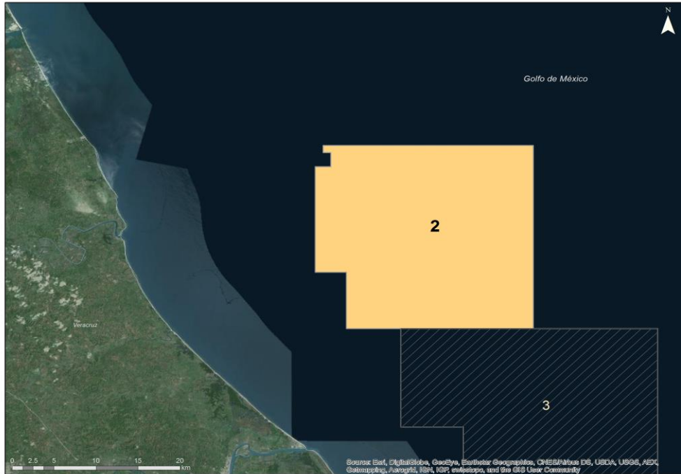
Recursos prospectivos (MMbpce)