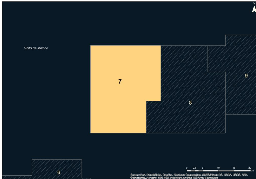
Recursos prospectivos (MMbpce)